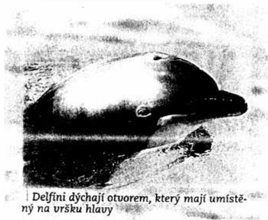
Delfíni dýchají otvorem, který mají umístěný na vršku hlavy